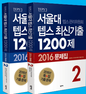
서울대 테스 관리위원회 테스 최신기출 1200제 2016 문제집/해설집 2